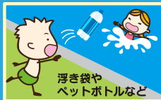
浮き袋やペットボトルなど